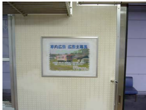
扉付近 (1位側 縦2区画) (2位側 横1区画)