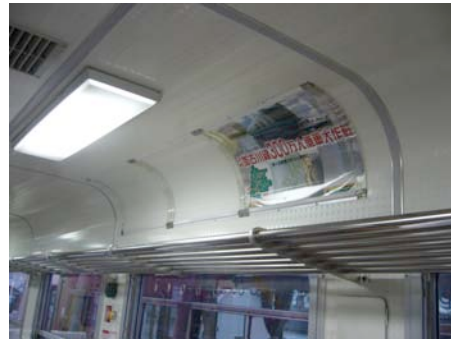
天井反り返り部分 6区画