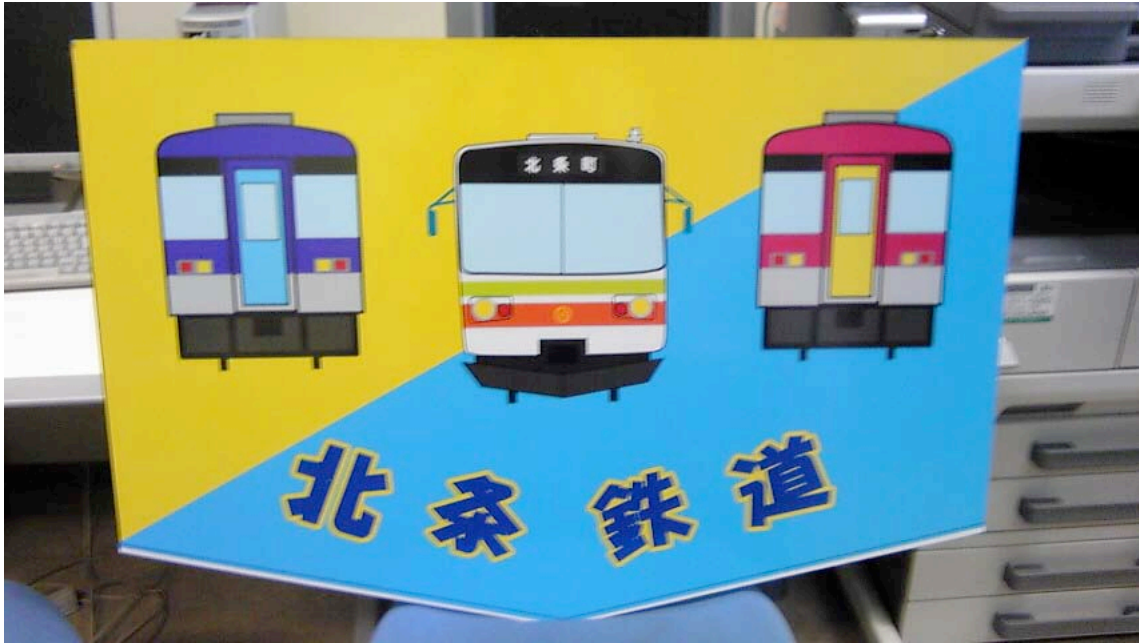
ヘッドマーク寸法